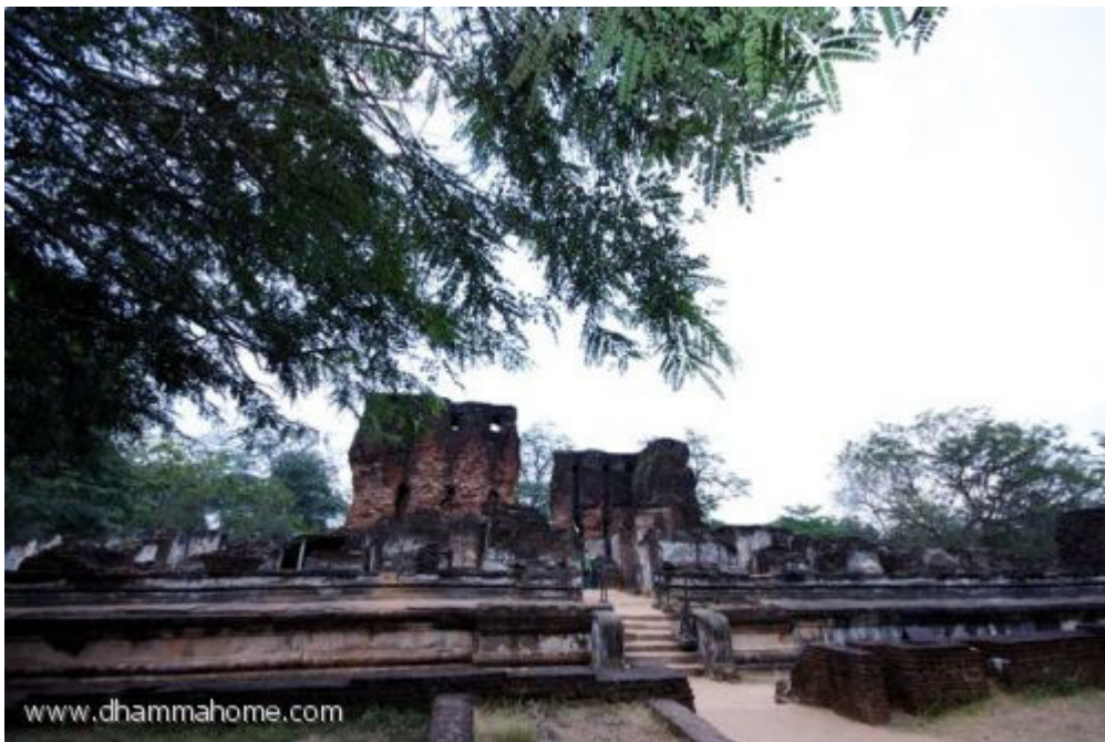
บริเวณพระราชวังในเมืองโปโลนนารูวา

วันนี้ คณะของเราได้ไปเยี่ยมชมเมืองที่เคยเป็นราชธานีแห่งที่สองของศรีลังกา เมื่อราวพันกว่าปีมาแล้ว คือเมืองโปโลนนารูวา ปัจจุบันเป็นเมืองมรดกโลก