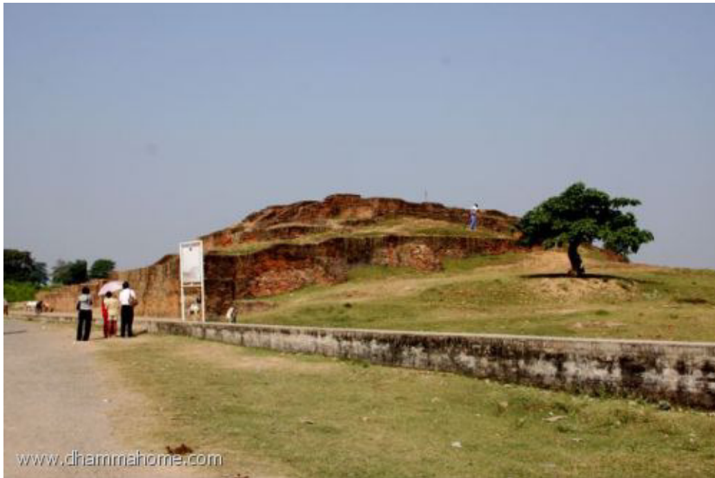
บ้านของบิดาท่านองคุลีมาล (อยู่เยื้องๆ กับบ้านของท่านอนาถฯ)