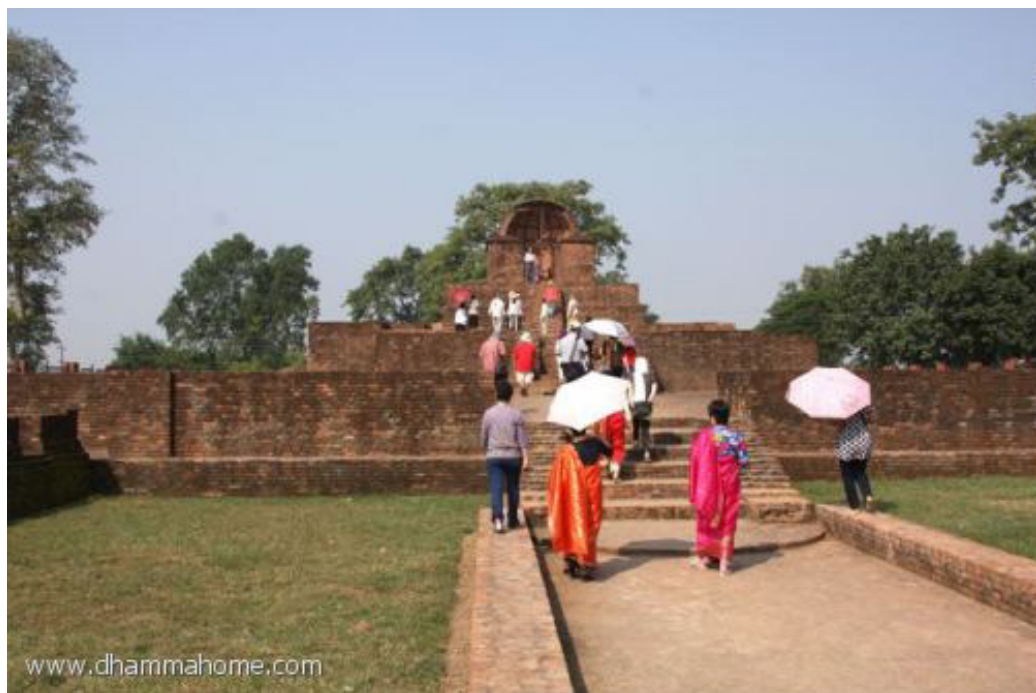
บ้านของนางวิสาขา