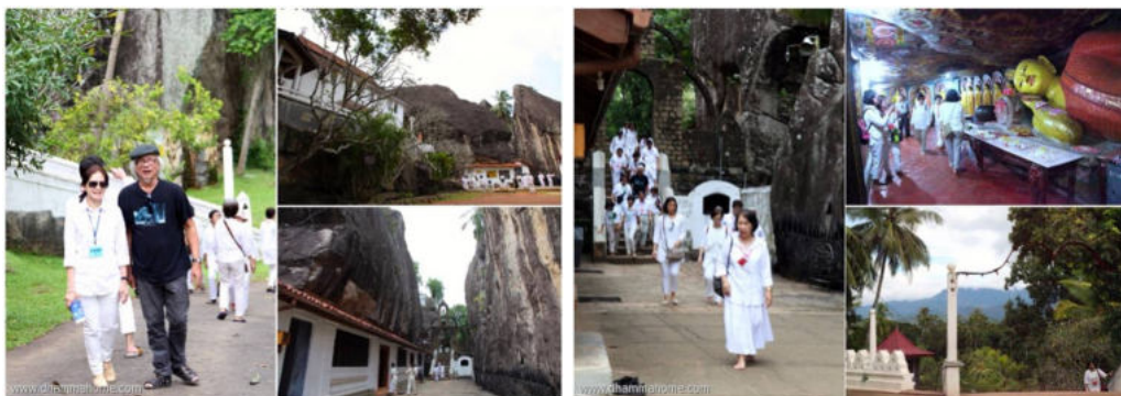
วัดอรุณวิหาร - Aluvihara Temple หรือที่เรียกกันว่า อโรคาวิหาร สถานที่สอนพระพุทธศาสนาจากพระไตรปิฎกที่จารึกในใบลาน ในอดีต

อย่างนั้นไม่ใช่ นั่นไม่ใช่ "ทาน" ทานจริง ๆ ก็มีสติเจตสิก ระลึกเป็นไปในทาน เพราะว่า เรามีของที่จะให้เป็น ประโยชน์แก่คนอื่นไม่น้อยเหมือนกัน แล้วแต่สติจะเกิด หรือไม่เกิด ถ้าสติไม่เกิด ก็ไม่ให้ ไซ้ไหม ทั้ง ๆ ที่เก็บไว้ ทำไมก็ไม่รู้ ไม่ได้ใช้เลย แต่พอสติเกิด ระลึกเป็นไปในทาน ให้ การให้จึงเกิดขึ้น ขณะนั้นจึงไม่ใช่เรา!!! แต่เป็นจิตที่ ประกอบด้วยเจตสิกฝ่ายดีที่ใช้คำว่า โสภณเจตสิก ขณะ นั้นก็แล้วแต่ว่า จะมีปัญญาเกิดร่วมด้วยหรือไม่มีปัญญา เกิดร่วมด้วย ต้องเป็นผู้ที่ตรง แต่ว่า สติต้องมีแน่ และสติ จะเกิดขึ้นเมื่อไหร่อีก? จะได้รู้จักสติ ก่อนสติปฏิฐาน เพราะว่า สติก็ต้องมีหลายชั้น สติที่เป็นไปในทานเท่านั้น ไม่ใช่สติปฏิฐานแน่นอน!!!