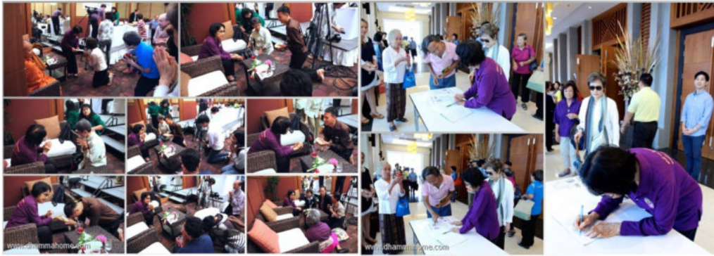
ภาพผู้ที่มาขอลายเซ็นจากท่านอาจารย์เป็นที่ระลึก หลังจบการสนทนาธรรมที่ จ.เชียงใหม่