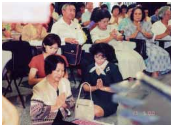
วันเปิดอาคารมูลนิธิฯ ๑๗ พฤษภาคม ๒๕๔๓