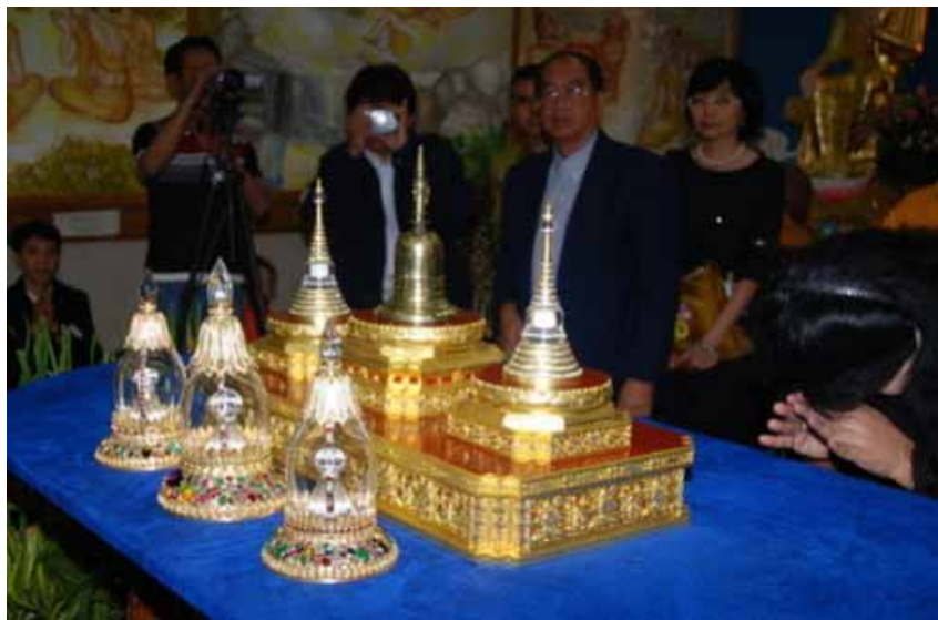
ผอบเจดีย์ที่ประดิษฐานพระบรมสารีริกธาตุ และพระธาตุของพระอัครสาวก

ของชีวิตอย่างคุ้มค่าที่สุด ความเจ็บป่วยที่แสนจะทรมาน มิได้เป็นอุปสรรค มิได้ขัดขวางมิให้เธอศึกษาธรรมยิ่งขึ้นแต่กลับทำให้เธอเพียรที่จะเข้าถึงธรรม โดยระลึกถึงสภาพธรรมที่ปรากฏกับตัวเธอเอง