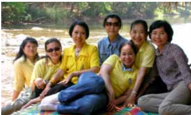
ที่สังขละกับสหายธรรม