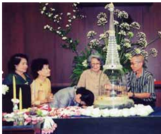
กราบนมัสการ พระบรมสารีริกธาตุ