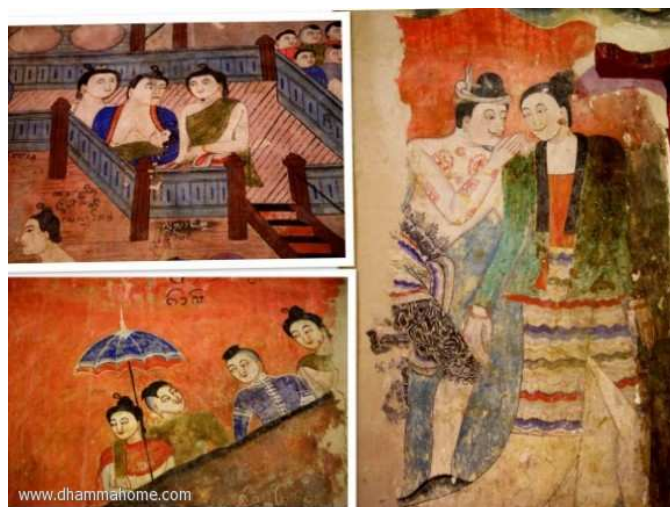
(ภาพจิตรกรรมฝาผนัง วัดภูมินทร์ น่าน)