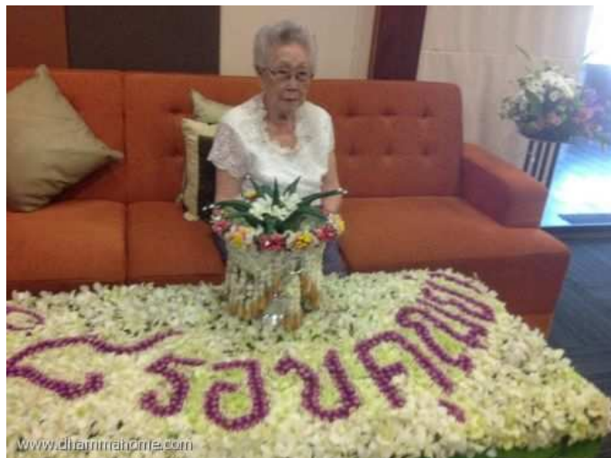
ครบ ๘ รอบคุณย่า