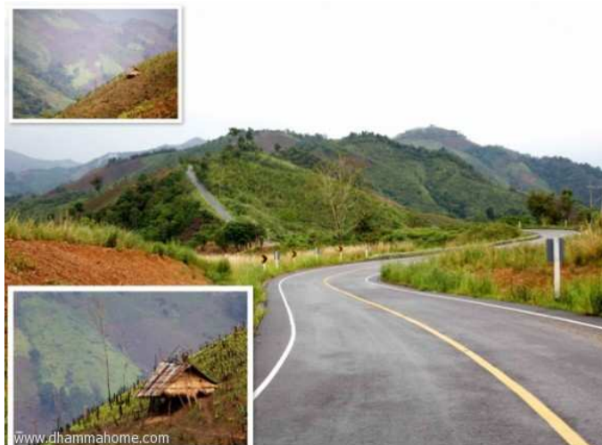
(ทางขึ้นอุทยานแห่งชาติดอยภูคา น่าน)

เมื่อ ๓๐ กว่าปีก่อน แดนดอยเมืองน่าน ได้ผ่านคืนวันแห่งการสู้รบระหว่างฝ่ายรัฐบาลกับพรรคคอมมิวนิสต์แห่งประเทศไทย (พคท.) อันเป็นผลจากการแปลกแยกแตกต่างทางอุดมการณ์การเมืองพื้นที่ป่าเขาห่างไกลมีเส้นทางเชื่อมต่อกับชายแดนลาวได้กลายเป็นฐานที่มั่นสำคัญในภาคเหนือของฝ่าย พคท. เหล่านักศึกษาปัญญาชนนับร้อยพันที่ขัดแย้งกับฝ่ายรัฐบาลในเวลานั้น ได้เดินทางเข้าป่าเพื่อร่วมกับ พคท. จัดตั้งกองกำลังอยู่ตามดอยสูง เช่น ดอยผาจิตและดอยวาว ตามแนวเทือกเขาภูคา-ป่าแดงนี่คือพื้นที่เก่าในฐานที่มั่นน่านเหนือเขต ๑ ที่เรียกว่าเขตภูแว และดอยวาว อีกทั้งยังมีผู้เข้าร่วมเป็นชาวไทยภูเขาทั้งม้งและลัวะ ด้วยแรงขับจากความทุกข์ยากเหลือมล้ำ จน