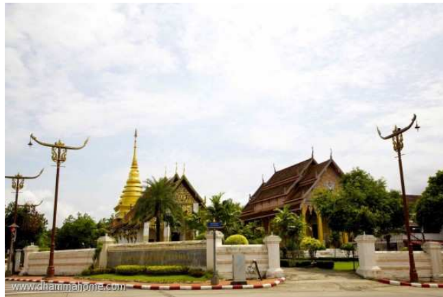
(วัดพระธาตุช้างค้ำวรวิหาร)