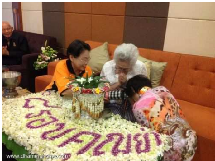
ท่านอาจารย์กราบคุณย่า