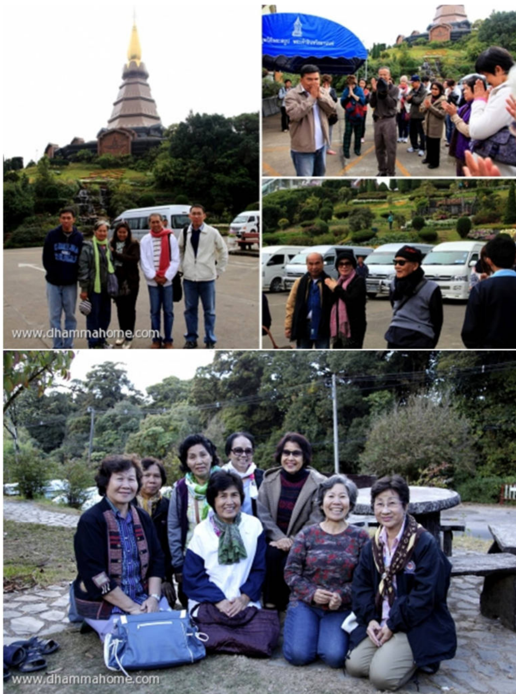
คณะสหายธรรมจากลพบุรี ที่เดินทางมาเที่ยว และได้พบท่านอาจารย์ที่นี่