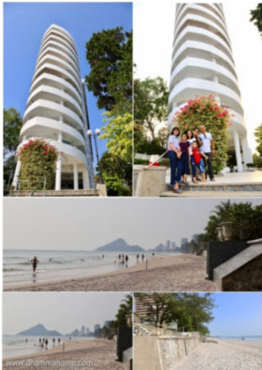
The Royal Princess Condominium หัวหิน มองเห็น เขาตะเกียบอยู่ไกล ๆ

ต้องเป็นความเข้าใจพระธรรมในหนทางที่ถูกต้องตรงตามที่ได้ ทรงแสดงไว้เท่านั้น หาไม่แล้ว หากหลงไปในหนทางที่ผิด มิจฉาทิฎฐิ ย่อมเป็นอันตรายอย่างยิ่งแก่สังสารวัฏของบุคคล นั่นเอง เพราะจะไม่สามารถพบกับหนทางที่จะออกจากทุกข์ใน สังสารวัฏได้ ทรงแสดงถึงที่สุดของความเห็นผิดที่สะสมจนมี กำลังนั้นว่า ทำให้จมดิ่ง ปักแน่นเป็นตอในวัฏฏะ วนเวียนอยู่กับ สุขและทุกข์แล้ว ๆ เล่า ๆ ออกไปไม่ได้เลยในที่สุด แม้จะรู้ว่าน่า สงสาร แต่ก็ไม่มีใครเอาปัญญาความเข้าใจที่ถูกต้องในหนทางไป ใส่ หรือไปให้แก่ใครได้ นอกจากความเข้าใจ (คือปัญญา) ของผู้ นั่นเอง ที่จะเกิดขึ้นจากการฟัง ใส่ใจ และพิจารณาไตร่ตรองโดย แยกกาย ด้วยตนเอง