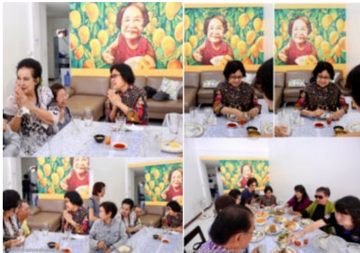
พี่จี๊ดบรรณาธิการด้วยตัวเอง เข้ากราบ ท่านอาจารย์และร่วมรับประทานอาหารด้วย

พระไตรปิฎกจึงไม่ใช่หนังสือธรรมดา ๆ ที่ใคร ๆ อ่านแล้ว จะเข้าใจได้ง่าย คำที่ดูธรรมดาแต่มีความละเอียดลึกซึ้งอย่างยิ่ง ผู้ที่ไม่ศึกษาย่อมไม่มีทางที่จะเข้าใจในอรรถอันลึกซึ้งนั้นได้ และโดยเฉพาะอย่างยิ่ง ผู้รู้ ที่มีความเข้าใจและสามารถชี้แนะถ่ายทอดให้เราเกิดความเข้าใจที่ถูกต้องได้ ด้วยความตรง ด้วยความจริงใจ โดยปราศจากความหวังในลาภสักการะและชื่อเสียงในสมัยนี้ หากท่านทราบและเข้าใจพระธรรมถูกต้อง ย่อมจะเป็นผู้ที่รู้เองว่ามีหรือไม่ มากหรือน้อยประการใด