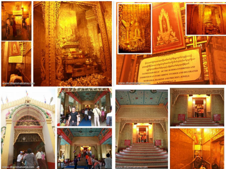
(เจดีย์ปิตาหวานที่บรรจุพระเกศาธาตุและพระบรมธาตุ)