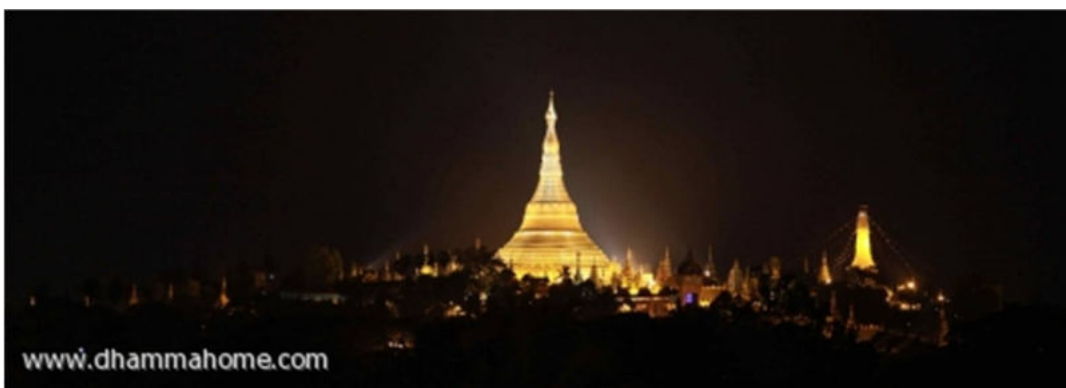
(ภาพพระมหาเจดีย์ชเวดากองยามค่ำคืน ถ่ายจากโรงแรมที่พัก)